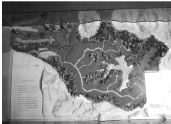
大型土地開発「土太郎構想」全体像の模型

定めの原産地証明用紙で証明書を作成し、申請を行う。当所にて審査を行い、証明書を発行するといった流れになる。詳しくは、当所貿易関係証明係(22)4305までお問い合わせください。